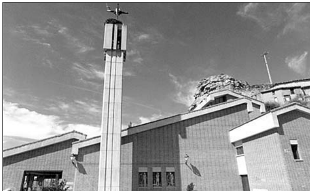
Fachada sur. De izquierda a derecha: porche, nave, tejado del presbiterio y sacristía con la torre en el centro

El cuarto templo dedicado en más de un milenio a San Martín en Albelda, es una iglesia moderna construida hace veinte años, donde se ve la confrontación entre la continuidad y la innovación que es una de las esencias del arte creativo.