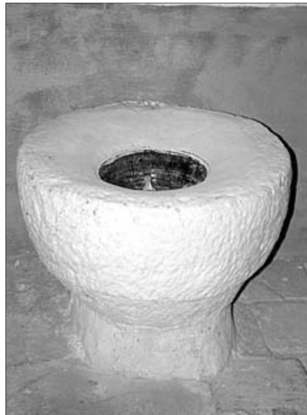
F.J.I. LÓPEZ DE SILANES

En Herce, Santa Eulalia, Arnedo y en las Bergasillas se desarrolló el eremitismo en la alta edad media, produciendo posteriormente diversos monasterios. Es posible que el origen de la iglesia románica sea eremítico pudiendo desarrollarse como un núcleo protomonástico, lo que en cierta forma explicaría su ubicación fuera de la población, que también enlaza con el uso de técnicas de construcción de tradición prerrománica en esta iglesia. Sea como fuere, esta iglesia podría datar de la época de repoblación, no olvidemos que Calahorra