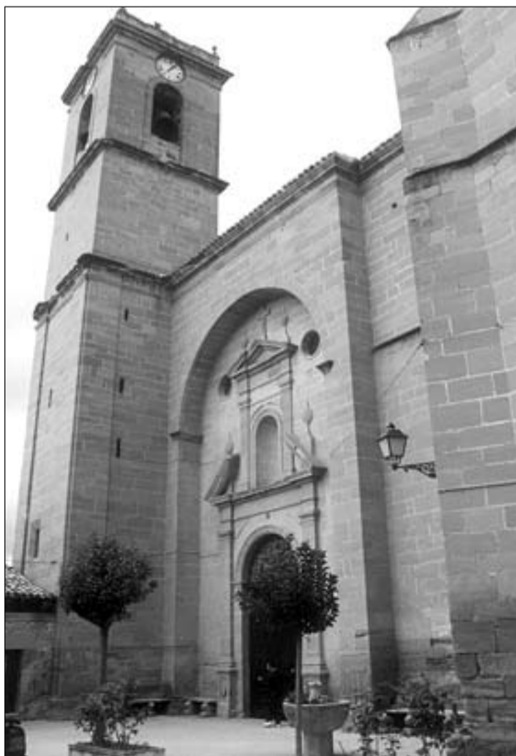
Fachada sur con la portada, la torre y la pila bautismal antigua. A la derecha, talla de San Vitores del siglo XVIII.