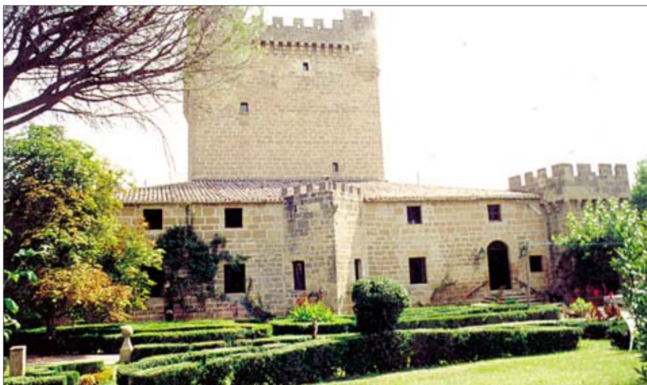
Fachada este, con cubo redondo oculto por los árboles, espolón central, cubo cuadrado a la derecha y la torre homenaje. Vista sureste, con el esquinazo cuadrado