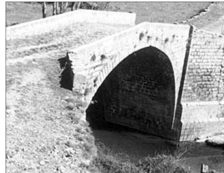
Puente de Sta. Bárbara, en el camino viejo de Préjano

tacamos la pintura en tabla de Santa Bárbara de la segunda mitad del XVI; el retabito formado por zócalo, relicario y dos casas laterales, de comienzos del XVII, con pinturas coetáneas en tabla, y la imagen de la titular, en realidad Santa Catalina, hispanoflamenca de fines del XV; en el lado de la Epístola hay una pintura sobre tabla de los Santos Emeterio y Celedonio de la primera mitad del XVII.