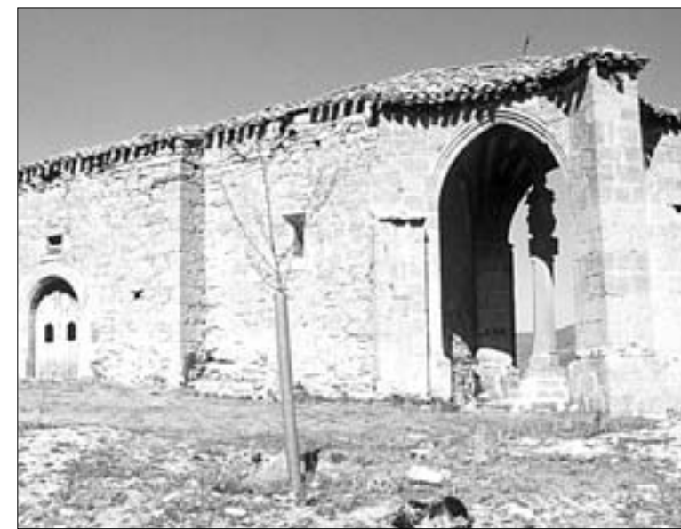
Ermita de la Concepción o de la Virgen del Rosario, y el crucero