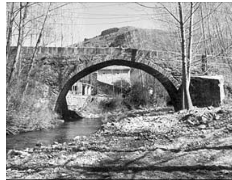
Puente del camino de Garranzo