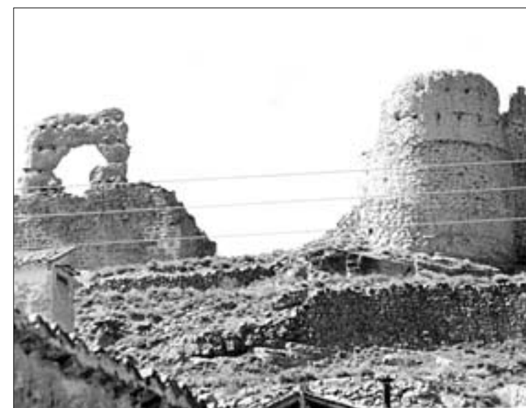
Ruinas del castillo, torre semicircular y de homenaje