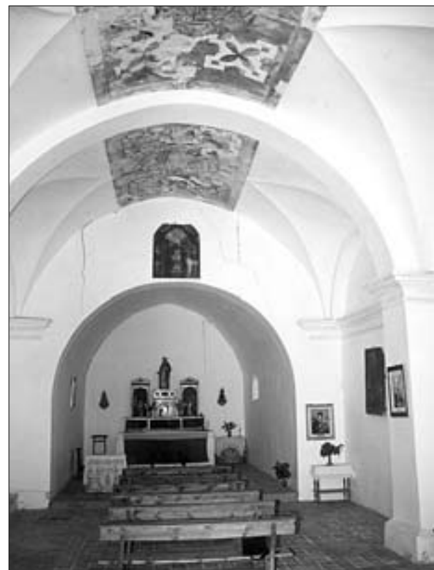
Interior de la ermita de la Virgen del Campo

El retablo original, de sobanco, banco y cuerpo, renacen-