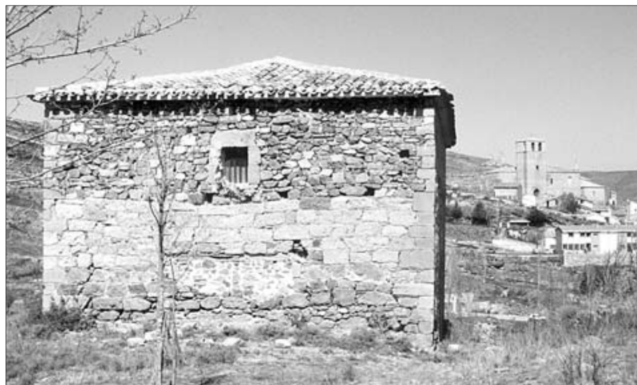
Fachada oeste de la ermita de la Virgen del Campo con la iglesia de Nª Sª de la Estrella y las ruinas del castillo, al fondo