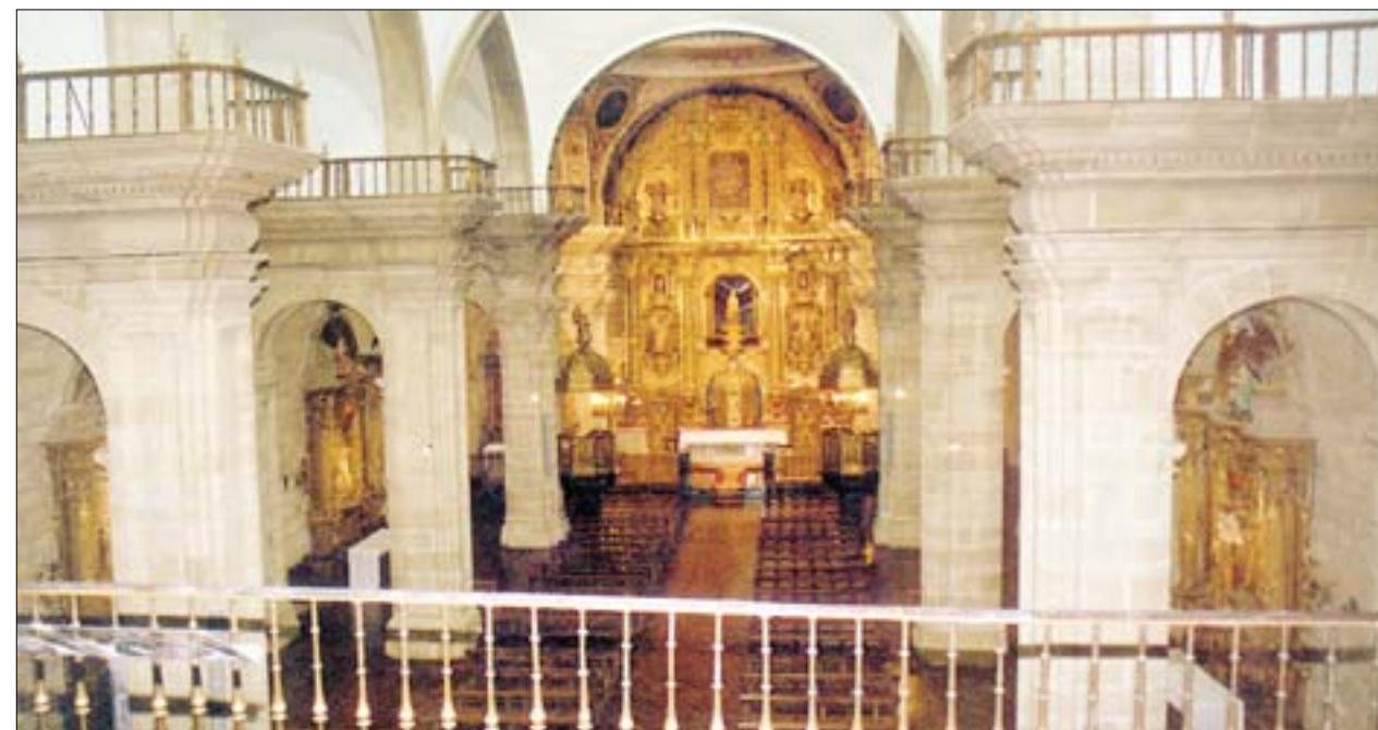
F.J.I. LÓPEZ DE SILANES

Pero bajo los mantones, se esconde la talla gótica de la Virgen de la Vega del siglo XIII-XIV, muy repintada y quizás algunas partes del Niño rehechas. Cubre su cabeza con una toca, y el cuerpo con un manto que deja ver la túnica, en la mano derecha lleva la manzana como símbolo de la segunda Eva, o madre del redentor, y en su mano izquierda sostiene al Niño en actitud de bendecir. Una corte de ángeles rodean el trono, mientras un niño ofrece el mejor fruto de