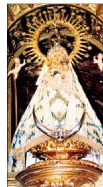
F.J.I. LÓPEZ DE SILANES

Cúpula de la sacristía (s. XVIII) donde se observan los estragos causados por el agua en la escena del fondo. En la imagen de la derecha, Virgen de la Vega, con sus símbolos en la mano derecha: la granada y las espigas de trigo, que representan sus tradicionales leyendas