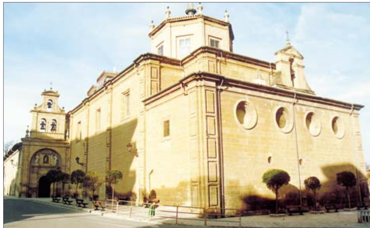
F.J.I. LÓPEZ DE SILANES

Vista sureste, donde resalta el escalonamiento de volúmenes desde la sacristía, pasando por el presbitero, el exterior octogonal de la cúpula hasta alcanzar el chapitel de la misma