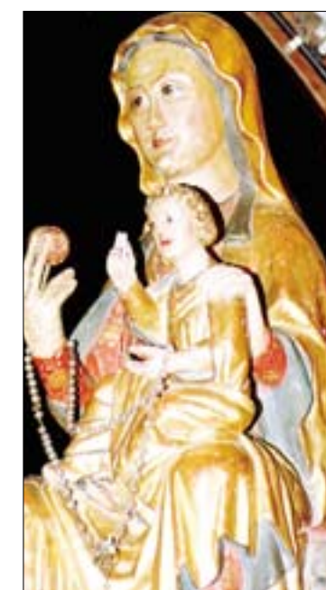
F.J.I. LÓPEZ DE SILANES

Cúpula de la basílica, con las pinturas de la Glorificación de la Virgen (s. XVIII). Talla de la Virgen de la Vega del siglo XIV