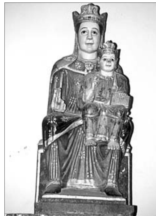
A la izquierda, Virgen de la Antigua esculpida en piedra (es raro en el románico). A la derecha, Virgen Negra, actualmente venerada en la capilla de Santa María de la Antigua

Fue robada de la iglesia de Santa María de Palacio el año pasado la Virgen del Ebro, así llamada porque fue encontrada a finales del siglo XIX flotando sobre el río Ebro. Es una talla de la Virgen, también sedente y románica, el Niño está sentado sobre su rodilla izquierda de frente bendi-