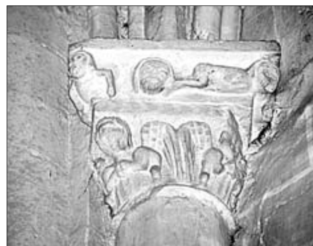
F.J.I. LÓPEZ DE SILANES

En la imagen de la izquierda, fachada sur, con la portada, la torre y la aguja gótica sobre el crucero. En el centro, pórtico-testero del segundo tramo de la nave de la epístola. En la fotografía superior derecha, capiteles de las columnas del último pilar de la nave central y en la imagen inferior-derecha, capitel del pórtico (tanto el capitel como el cimacio están historiados)