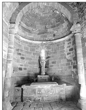
Un arco sobre columnas adosadas separa el ábside del anteábside

circulares precedidos de sus correspondientes anteábsides de la misma anchura y de gran profundidad, que desembocaban en naves de dos tramos; estos ábsides estaban comunicados entre sí mediante dos arcos de medio punto. De todo esto, tan solo quedan las ruinas del presbiterio.