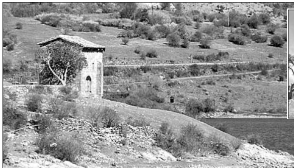
Junto a las aguas del pantano de Mansilla, la ermita de Santa Catalina es el único vestigio importante del pasado de esta localidad. En la imagen superior derecha se aprecia que el banco del ábside y las primeras hileras de sillares están erosionados