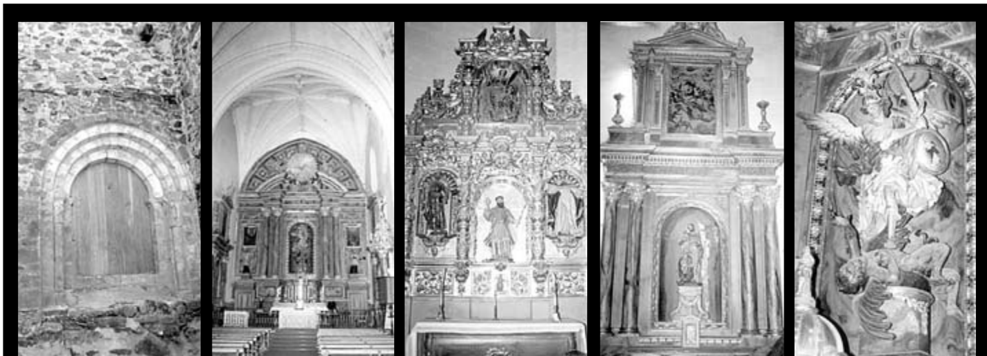
Arriba, planta de la iglesia y vista exterior. Abajo de izquierda a derecha, portada románica en el muro norte. Interior de la nave y el presbiterio. Retablo de San Ramón Nonato. Retablo de San Bartolomé. Grupo escultórico San Miguel presidiendo el Retablo mayor.

La iglesia de San Miguel en Ortigosa de Cameros