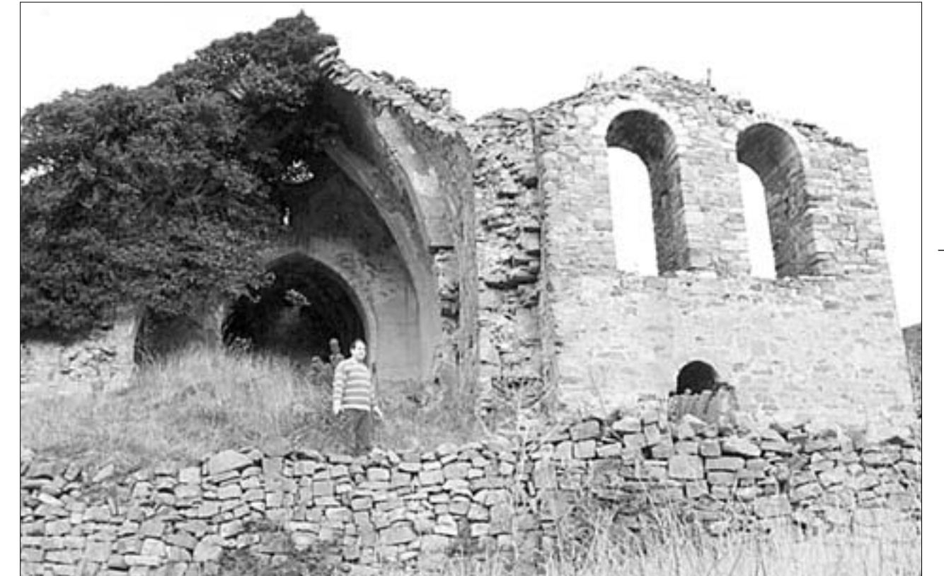
Iglesia de Santa María en Robres del Castillo. Vista de las ruinas de la nave y de la espadaña

Al final del recorrido, queda la tristeza por un mundo que se pierde en los pueblos serranos abandonados y el recuerdo de la belleza de su arte