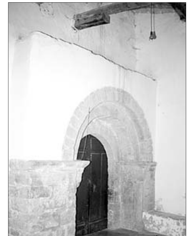
La nave de San Miguel en Robres, con su bóveda amenazada por las goteras y su portada románica