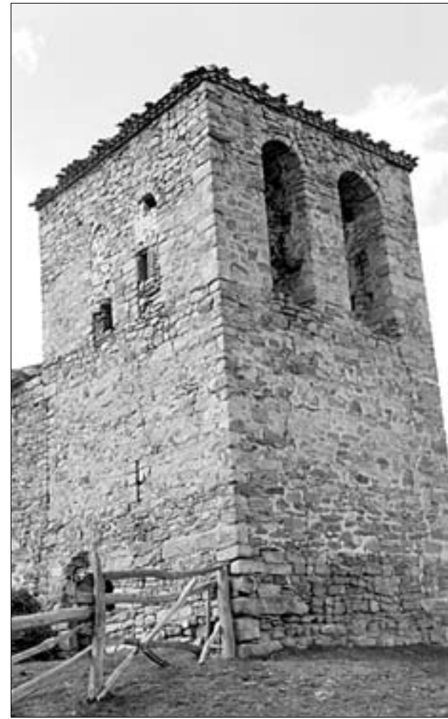
Vista panorámica de La Santa, villa hoy despoblada, y en donde resalta la iglesia de la Asunción, con su nave, que hace las veces de corral, y su torre

Estamos asistiendo en la cuenca alta del río Juberá a la extinción de los últimos rescoldos de la brillante estela del monasterio de San Prudencio en monte Laturce.