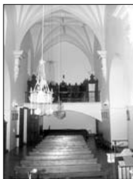
Vista del hastial oeste con la torre desde el pueblo y vista interior de la nave, con el coro alto al fondo con sillería.

micircular, para amadrigar las imágenes de Santa Bárbara del siglo XVIII, y Jesús Niño en uno, y en el otro a la Virgen del Rosario del siglo XVI, y a una Virgen del Pilar procedente de Valdeosera. En la sacristía resalta un retablo rococó procedente de Vellilla que sustenta un Cristo del XVII en el cuerpo y la Santa Faz en el ático. También hay que mencionar dos retablos gemelos de un cuerpo entre columnas entorchadas, rematados en frontón curvo y roto, procedentes de las capillas del primer tramo de la iglesia de la Asunción de Valdeosera.