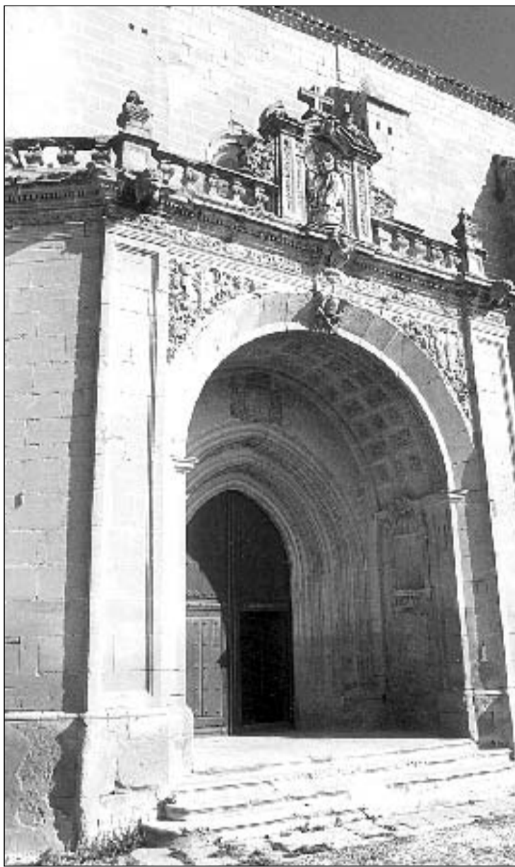
Abajo, fachada sur de la iglesia de Santa María la Mayor, apreciándose la torre, la portada, y su ubicación dentro de la fortaleza, que ya se ha quedado vacía del caserío. Arriba, pórtico barroco que sigue el modelo de un arco triunfal, encasetonado en el intradós.

Esta estructura central se completó por el muro norte con la escalera al coro alto y la sacristía; y por el muro sur, con un pórtico que cobija la puerta apuntada formada por tres grupos de baquetones en derra-