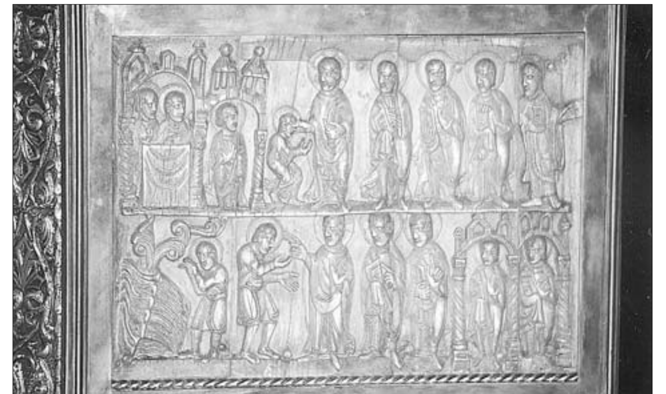
Arqueta de San Felices, última cena y curación del ciego de nacimiento