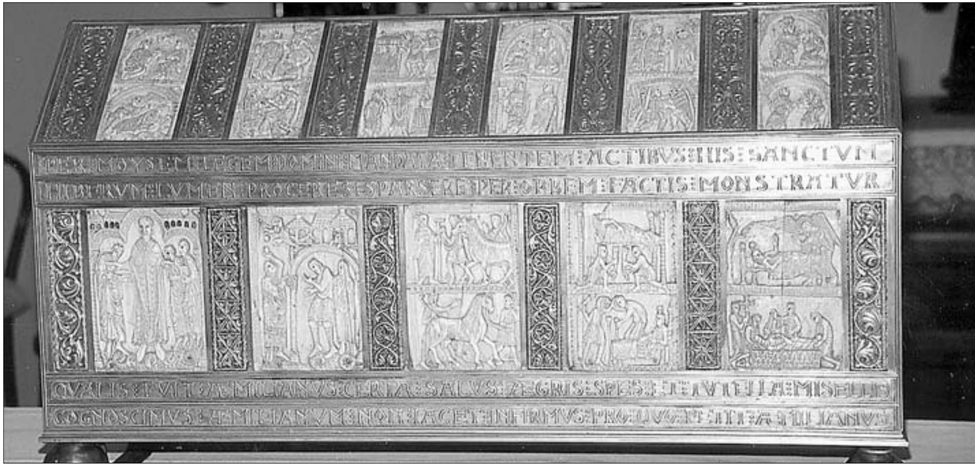
Vista del lateral principal de la arqueta de San Millán. En la fotografía superior derecha, imagen principal de la arqueta de San Felices

Una de las joyas más valiosas del Monasterio de San Millán de la Cogolla, son las arquetas donde se veneran los restos de San Millán y de su maestro San Felices. Son valiosas por su historia, y por el arte de las esculturas sobre marfil que celosamente custodian el Monasterio e importantes museos de España, Estados Unidos, Alemania, Austria, Italia y Rusia.