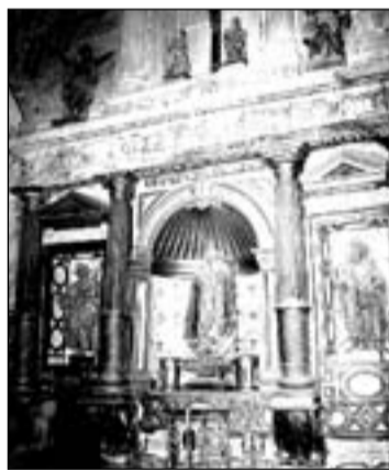
Retablo de la capilla de los Ruiz del Castillo.

De planta cuadrada cubierto con cúpula sobre pechinas rematada en linterna. Se abre a la nave mediante un arco cubierto con una reja de la época. El muro oriental está ocupado por el retablo con arquitectura labrada en piedra. En la pared norte se encuentra la tumba de los fundadores, centrada en sus estatuas orantes dentro de una arquitectura monumental esculpida en la propia pared. La sacristía se localiza al este del panteón, estando cubierta mediante una bóveda de terceletes y combados, con los símbolos del escudo en las claves. Al oeste está la escalera de la balconada que utilizó la familia para seguir los oficios religiosos, de la que todavía puede verse los mensulones en que apoyaba; todo con reminiscencias escorialenses. El sepulcro de Pedro Ruiz del Castillo y Juana de Encío fue construido bajo un frontón curvo, roto por el monumental escudo, todo soportado por dos pares de columnas estriadas, que inscriben el arco