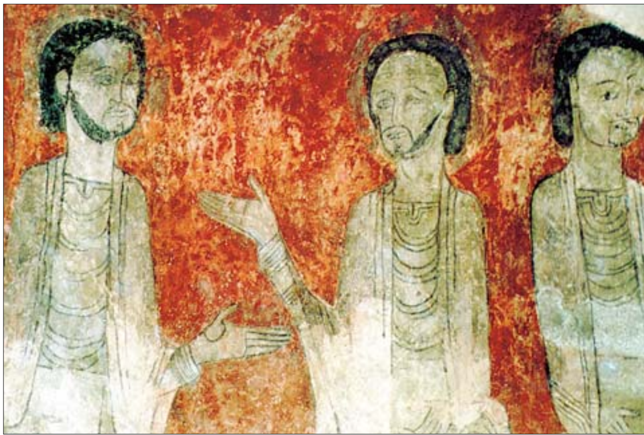
Detalle del apostolado una vez restaurada la pintura. A la derecha, situación de la ermita, refugiada en un abrigo de las rocas