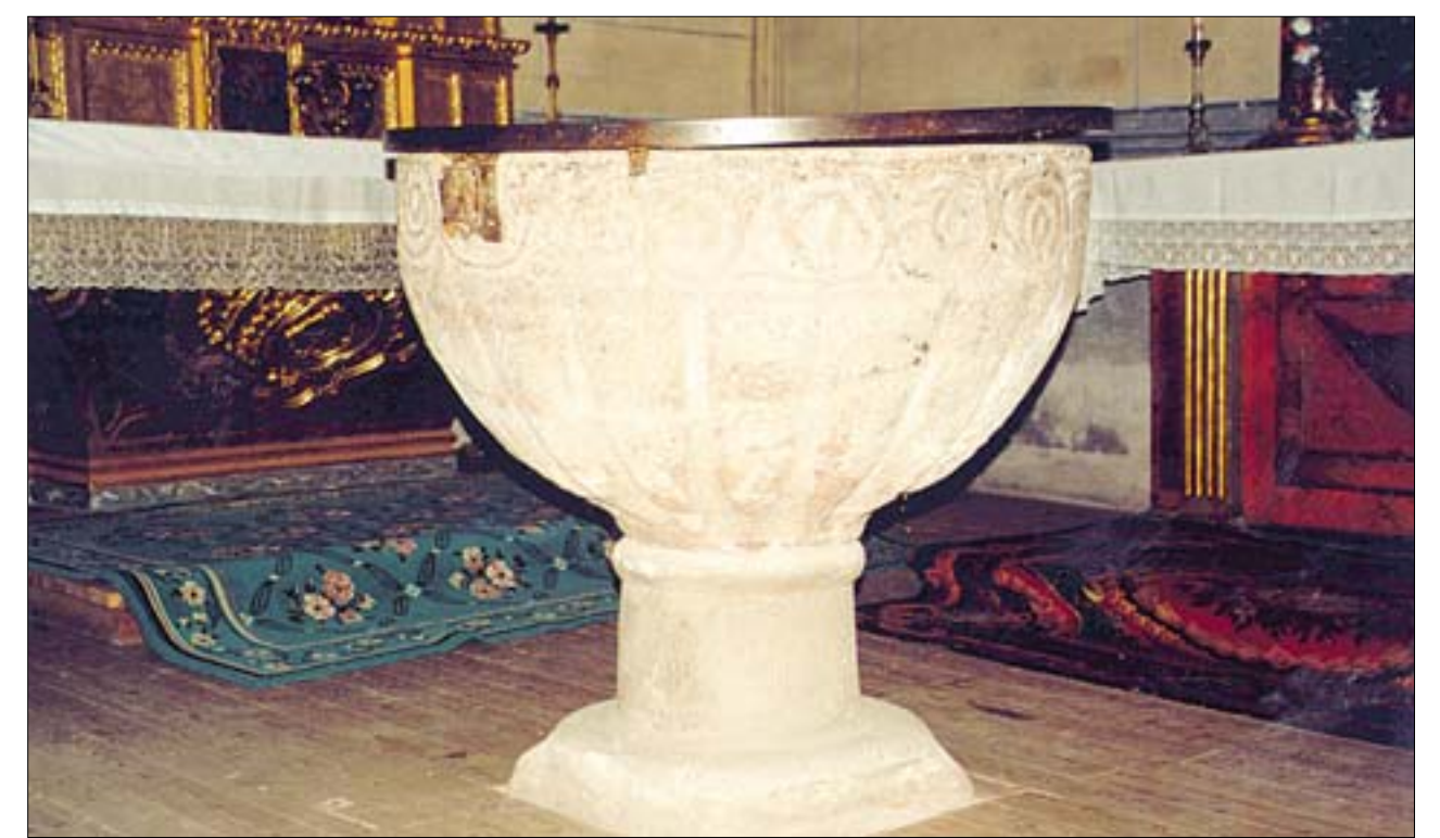
En la imagen superior izquierda, vista del puente medieval. De arriba a abajo, vista del espacio interior que se ve realizado por la falsa nave del evangelio, y pila bautismal